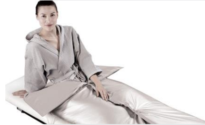
thermo slim blanket